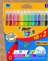
ROTULADORES BIC®KIDS KID COULEUR