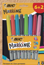
MARCADORES PERMANENTES DE COLORES BIC® MARKING