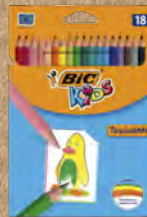
LÁPICES DE COLOR BIC@KIDS TROPICOLORS