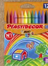
CERAS BIC@KIDS PLASTIDECOR®.