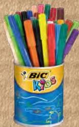
ROTULADORES BIC@KIDS VISA®.